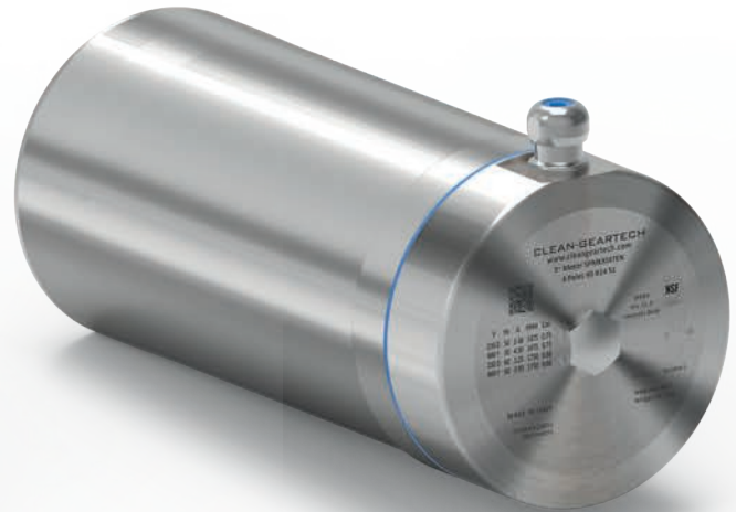
On request terminal box with cable gland in radial position

For the complete documentations please visit our web site: www.cleangeartech.com