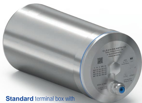
Standard terminal box with cable gland in axial position