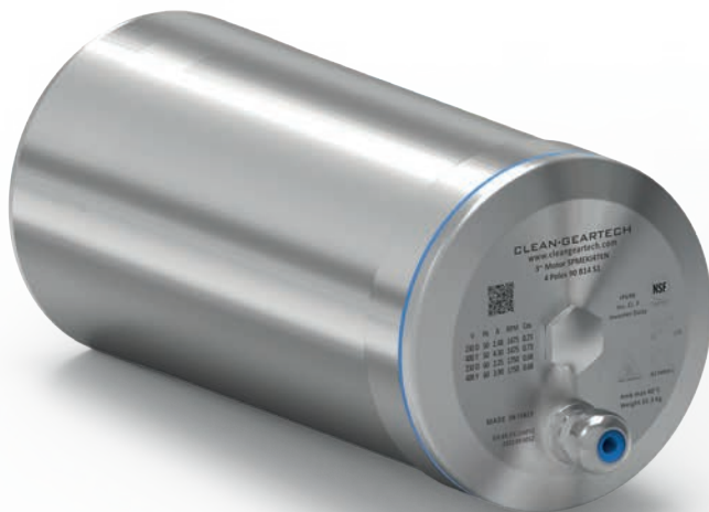
Standard terminal box with cable gland in axial position